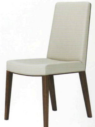
2 オペラム 1N