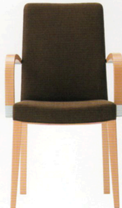
3 オペラW 5N